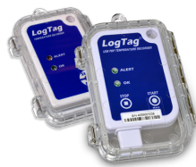
Boîtier de protection (non inclus)