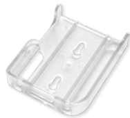
Support mural (non inclus)