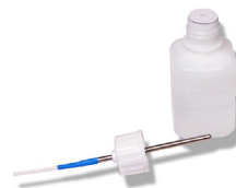
Glycol (non inclus)